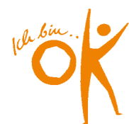
„Kein Stück Liebe“, Theater Akzent (2016)